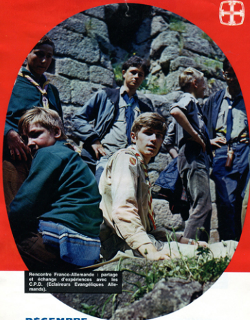
Rencontre Franco-Allemande : partage et échange d'expériences avec les C.P.D. (Eclaireurs Evangéliques Allemands).