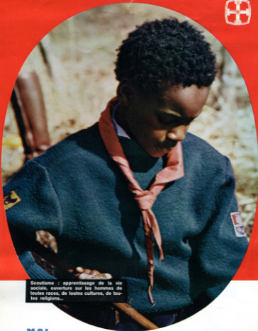
Scoutisme : apprentissage de la vie sociale, ouverture sur les hommes de toutes races, de toutes cultures, de toutes religions...