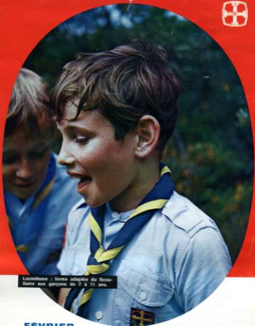
Louvetisme : forme adaptée du Scoutisme aux garçons de 7 à 11 ans.