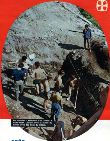
Un chantier : réfection d'un chalet à Saint-Véran. Contact avec la réalité du travail, avec des gens du métier.