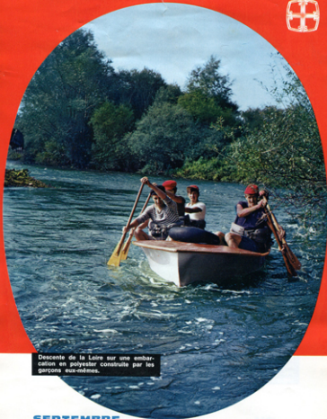
Descente de la Loire sur une embarcation en polyester construite par les garçons eux-mêmes.