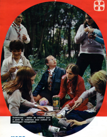
Eclaireuses : atelier de création pure à partir de matériaux pour cultiver et développer l'imagination.