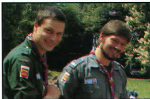
△ FOTOFEEUF SN (Normandie)