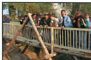
ÉCLAIREUSES, ÉCLAIREURS UNIONISTES 15, rue Klock 92110 Clichy. Tél. (1) 42.70.52.20

LA QUESTION LA PLUS PERMANENTE ET LA PLUS URGENTE DE LA VIE EST CELLE- CI : « QUE FAITES-VOUS POUR LES AUTRES ? » MARTIN LUTHER KING