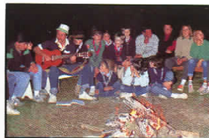
ÉCLAIREUSES, ÉCLAIREURS UNIONISTES 15, rue Klock 92110 Clichy. Tél. (1) 42. 70. 52. 20

ALORS LES YEUX DES AVEUGLES VERRONT ET LES OREILLES DES SOURDS S'OUVRIRONT. ALORS LE BOITEUX BONDIRA COMME UN CERF ET LA BOUCHE DU MUET CRIERA DE JOIE. DES EAUX JAILLIRONT DANS LE DÉSERT, DES TORRENTS DANS LES STEPES. LA BIBLE, ESAÏE 35:5ss