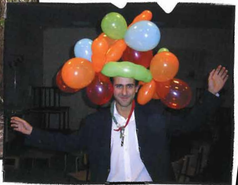
Punch : formation de formateurs