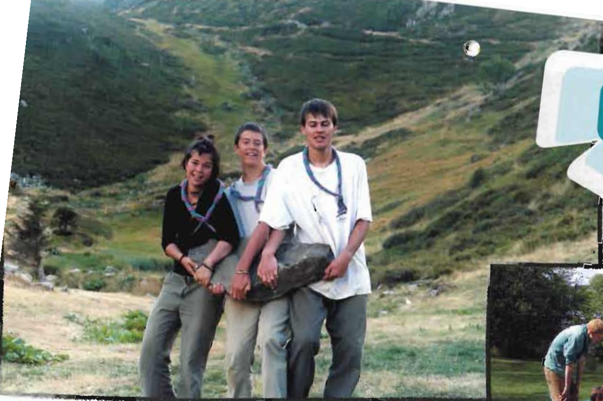
Alsace - Lorraine