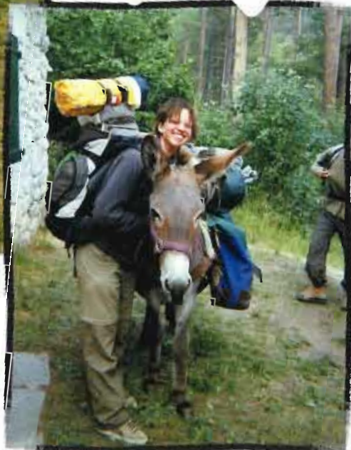
Ile de France Sud-Est

Éclaireuses et Éclaireurs Unionistes de France 15, rue Klock - 92110 Clichy - Tél. : 01 42 70 52 20 - Fax : 01 47 30 40 30 - www.uef.fr