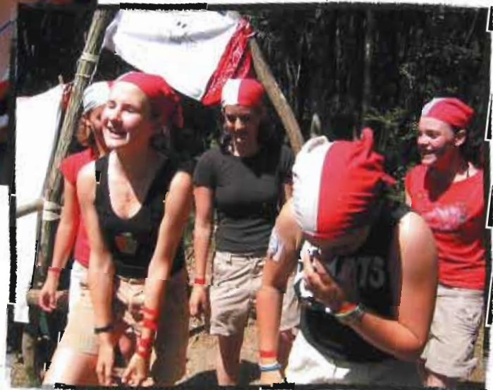
Val de Seine

Éclaireuses et Éclaireurs Unionistes de France 16, rue Klock - 92110 Cligny - Tél. : 01 42 70 52 20 - Fax : 01 47 30 40 30 - www.uef.fr