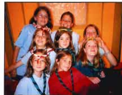
île de France Sud-Est