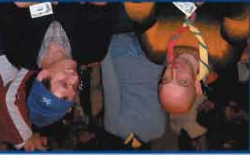
Assemblée Générale des FEUDF 2004

Soutenir le scoutisme unioniste Adultes, le Mouvement a besoin de vous ! Vous pouvez aider les responsables à vivre un scoutisme de qualité. Votre expérience, votre recul, vos compétences font de vous des alliés inestimables. Rejoignez un groupe pour apporter votre aide et participez à l'ambitieuse aventure des Éclaireuses et Éclaireurs Unionistes.