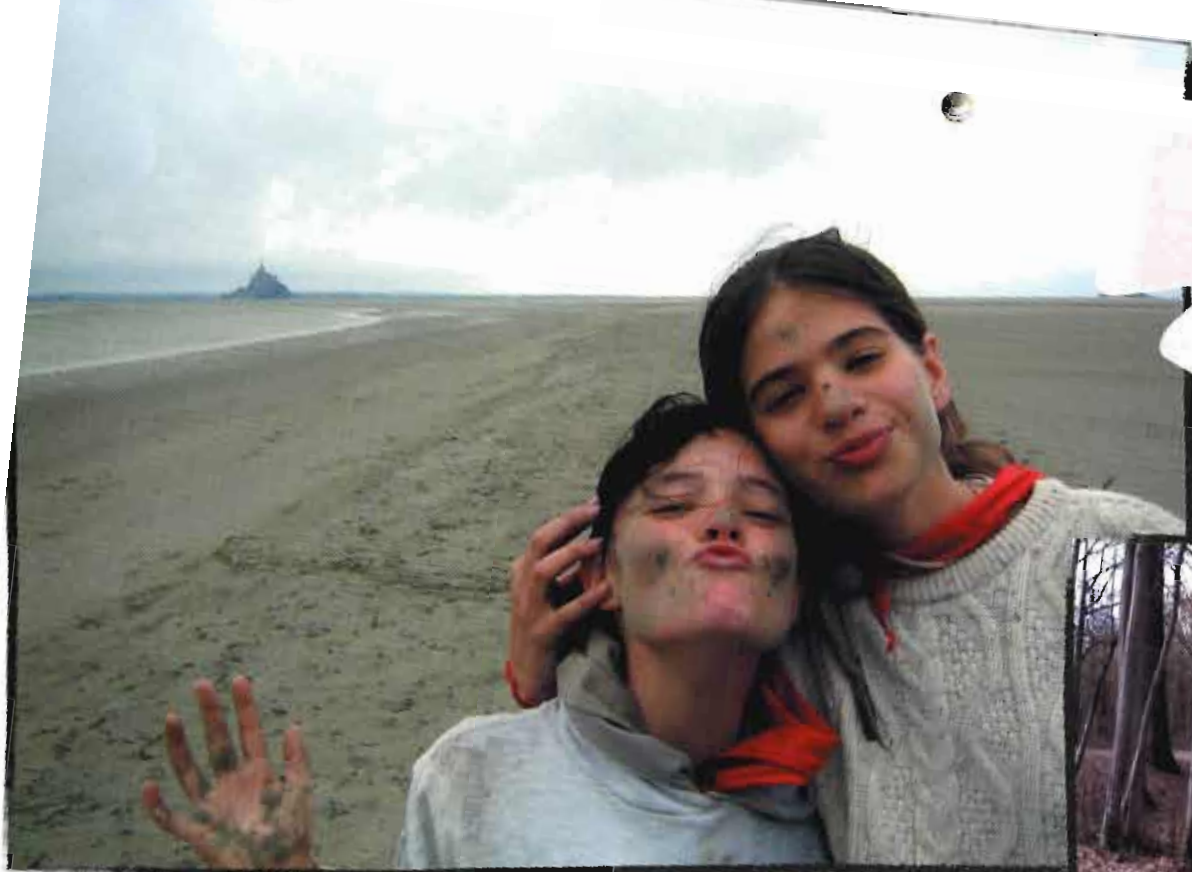
Val de Seine