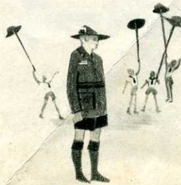
Lord et Lady Baden-Powell