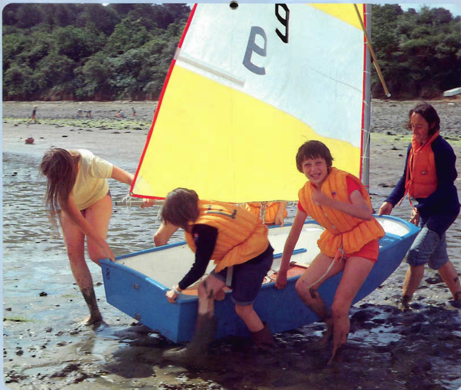
Photofeur J.-A. Seyng