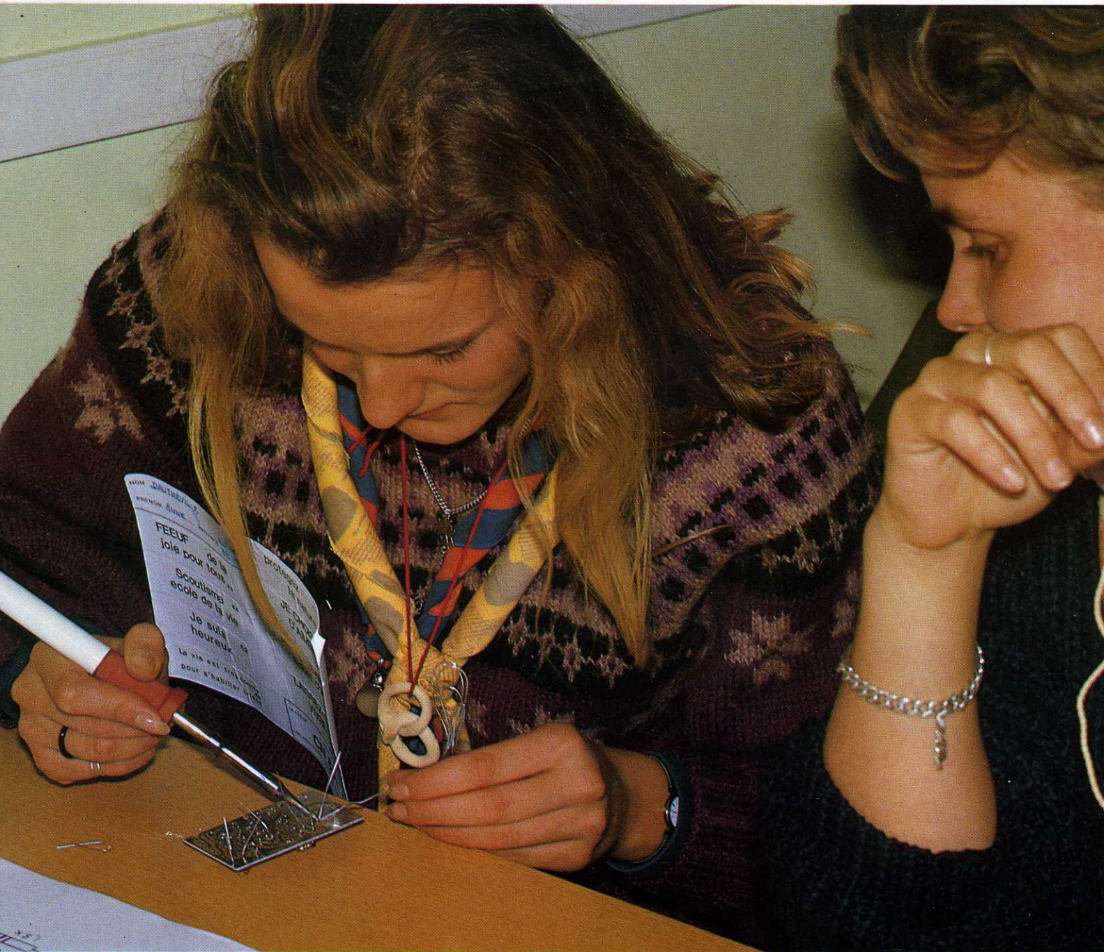
FOTOFEEUF - P. BALAS