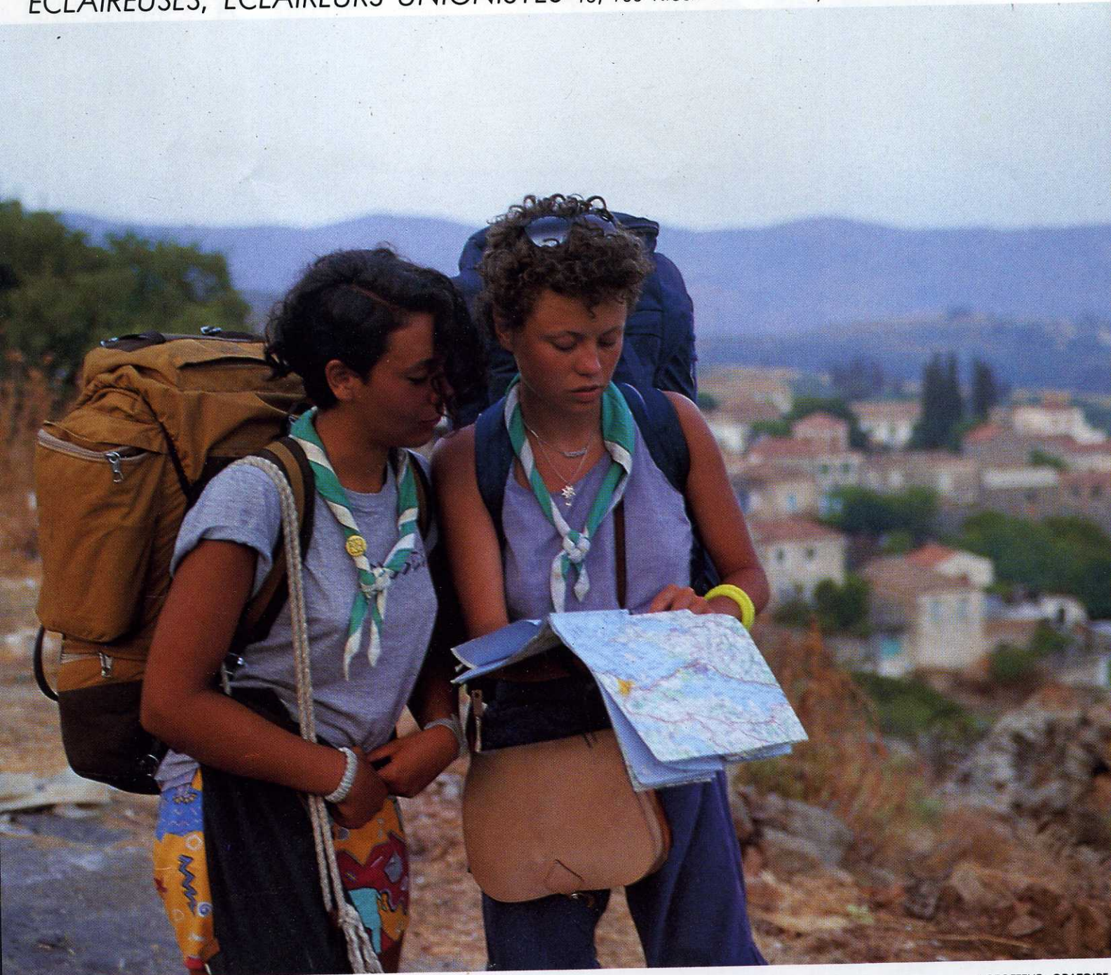
FOTOFEEUF - ORATOIRE