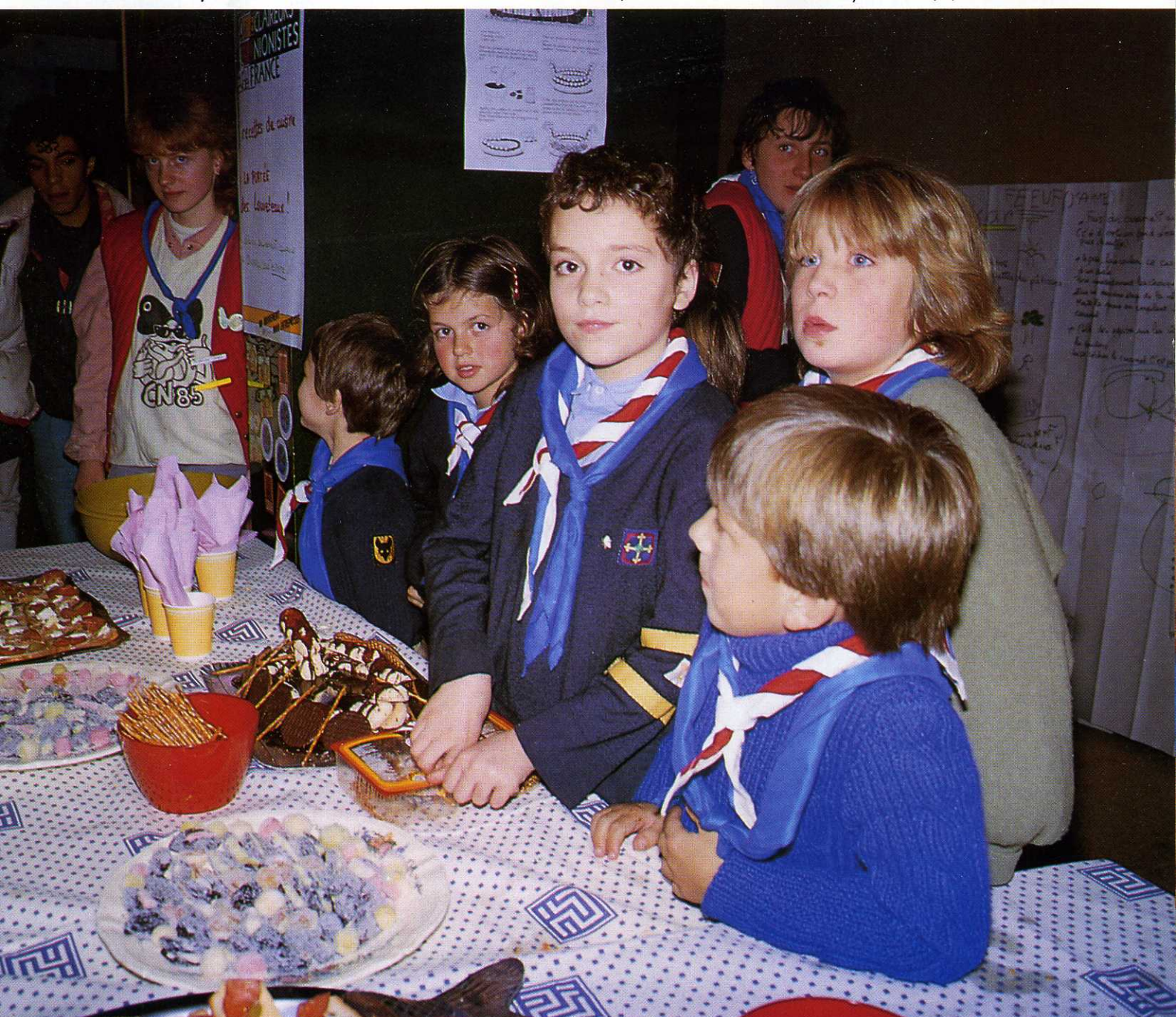
FOTOFEEUF - P. BALAS