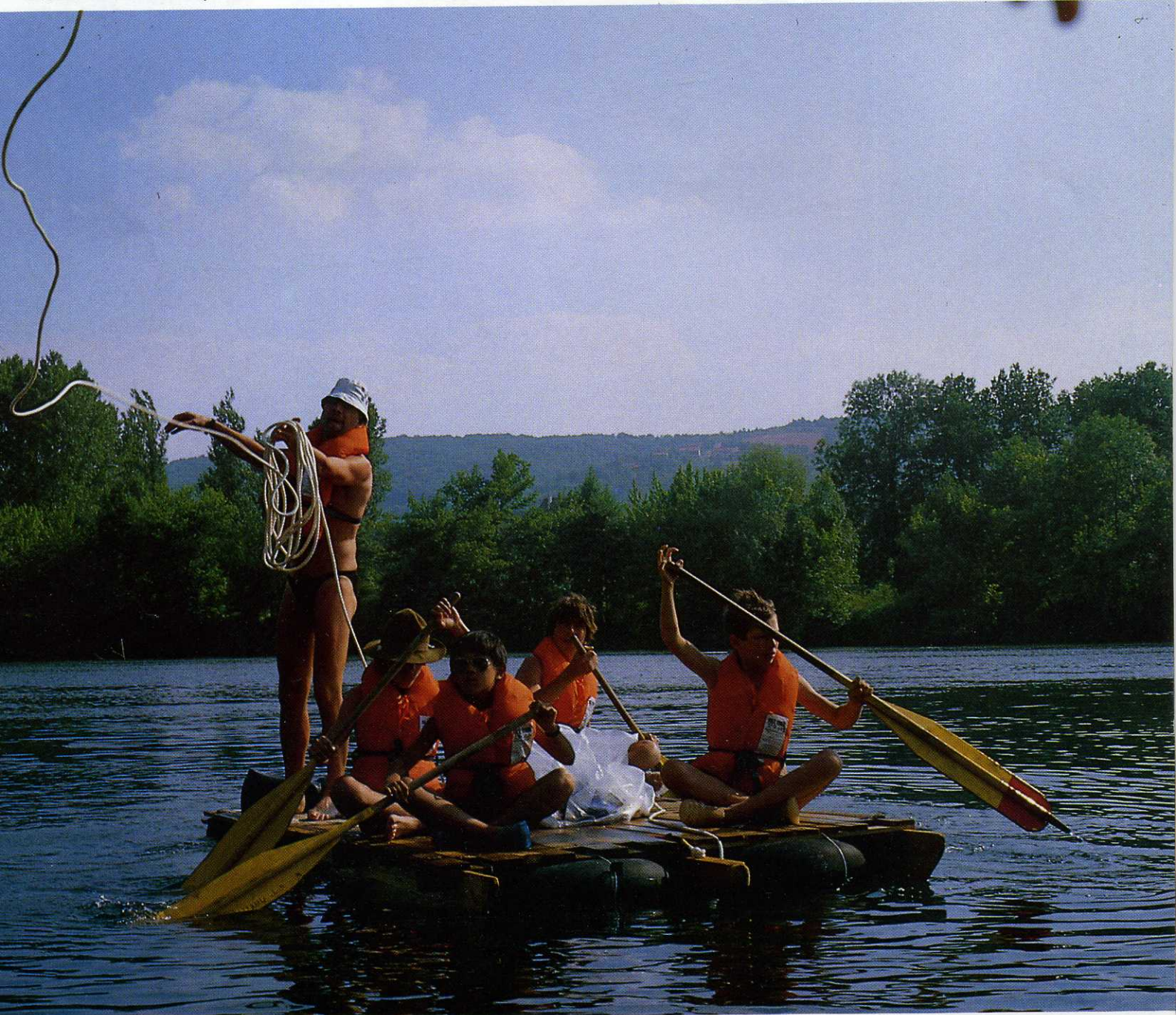
FOTOFEEUF - P. PUJA