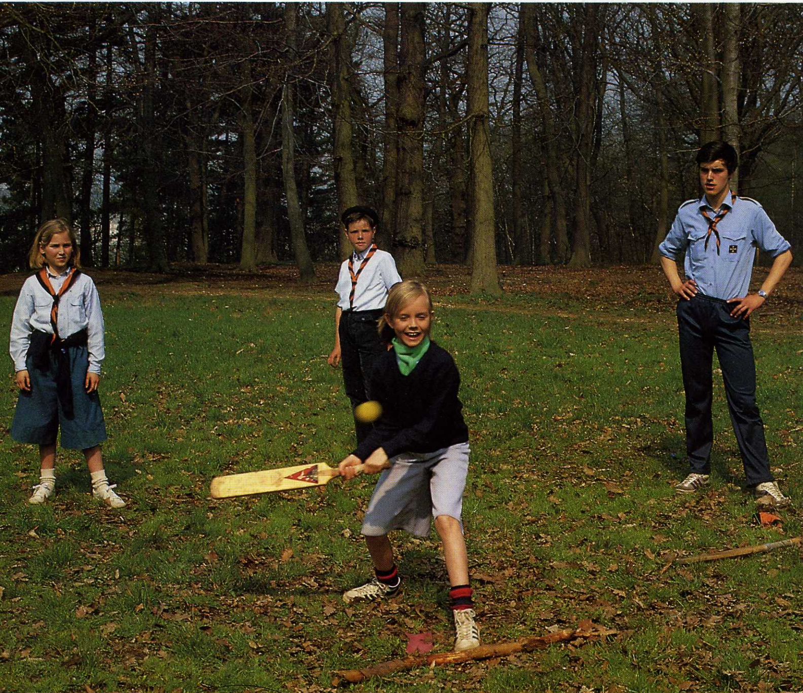
FOTOFEEUF - D. SALLES