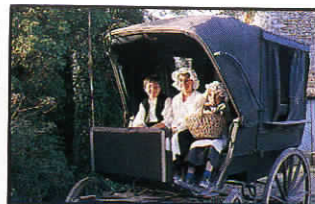
ÉCLAIREUSES, ÉCLAIRES UNIONISTES 15, rue Klock 92110 Clichy. Tél. (1) 42.70.52.20

DE LEURS ÉPÉES, ILS FORGERONT DES PIOCHES ET DE LEURS LANCES DES FAUX, ET CHACUN POURRA TRAVAILLER EN PAIX. MICHÉE 4-3