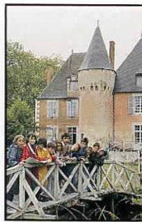
ÉCLAIREUSES, ÉCLAIREURS UNIONISTES 15, rue Klock, 92100 Clichy. Tél. (1) 42.70.52.20

PARS, SURTOUT NE TE RETOURNE PAS ; QUOI QU'IL ARRIVE, JE SERAI AVEC TOI, ALORS PARS ! JACQUES HIGELIN