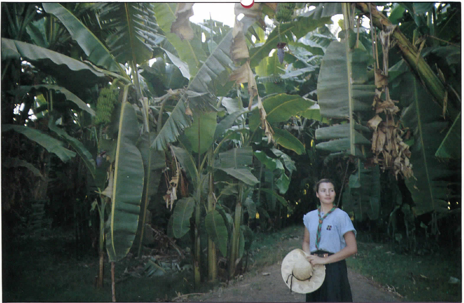
FOTOFEEUF: ▽ BAU BOIS COLOMBES (en Norvège), △ BAU LE HAVRE (en Egypte), ▽ F. MUZART (BAU Tonneins)

ÉCLAIREUSES, ÉCLAIREURS UNIONISTES 15, rue Klock 92110 Clichy. Tél. (1)42.70.52.20