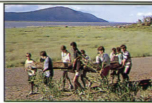
ÉCLAIREUSES, ÉCLAIREURS UNIONISTES 15, rue Klock 92110 Clichy. Tél. (1) 42.70.52.20

RETROUVER PAR LE JEU L'ENTHOUSIASME DES GRANDS EXPLORATEURS.