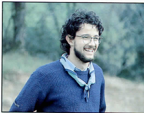
△. FOTOCARANICOLAS (Haut-Languedoc)

Merci de nous aider, cette année encore, à faire vivre nos convictions.