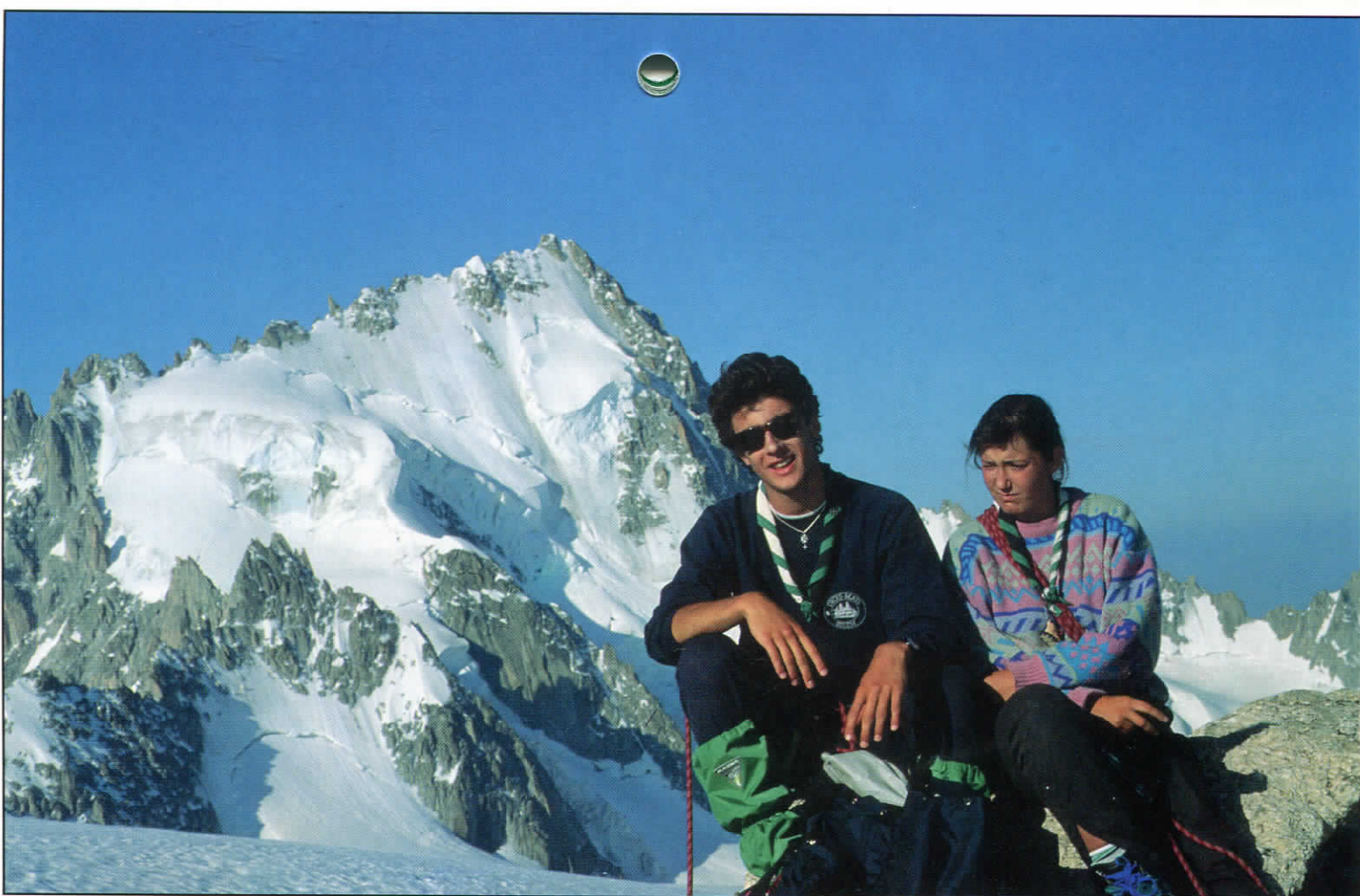
FOTOFEEUF : ▲ BAU LES CHOUCAS (Montpellier) ▼