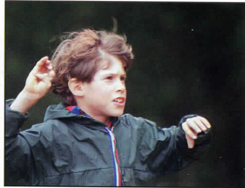
Δ FOTOFEEUF : P. BALAS (Aquitaine)

Sur l'élan de notre dernier congrès qui a rassemblé 1000 membres responsables ou cadres du mouvement, l'année 1993 sera pleine de grands projets. Des projets nés de l'imagination des enfants, des adolescents et des responsables. Des projets vécus localement pour répondre aux besoins des quartiers, des copains d'école... Des projets pour oser un scoutisme actuel, dynamique et formateur. Un scoutisme en action dans notre société. Grâce à votre aide les rêves deviennent réalité, la solidarité est possible, le scoutisme est offert à tous. Merci pour cette aide.