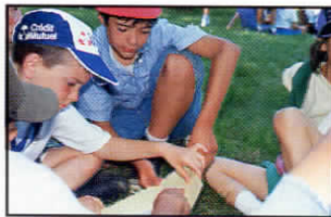
ÉCLAIREUSES, ÉCLAIREURS UNIONISTES 15, rue Klock 92110 Cligny. Tél. (1) 42. 70. 52. 20